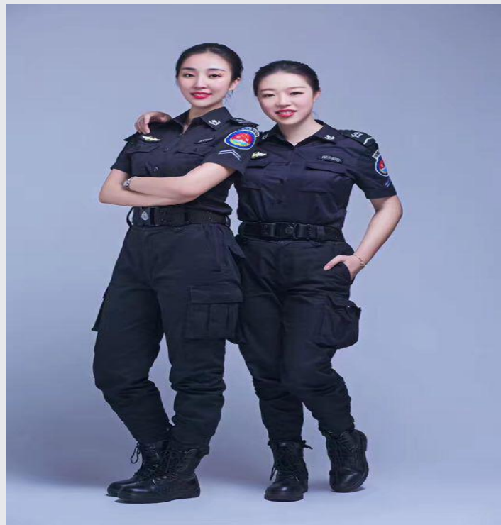
2014 级学生在海口机场实习