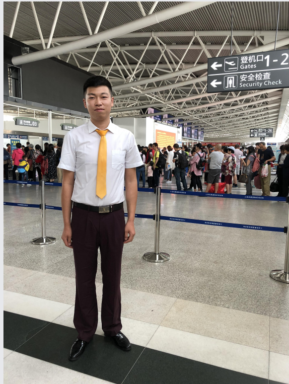
2016 级学生在三亚机场实习