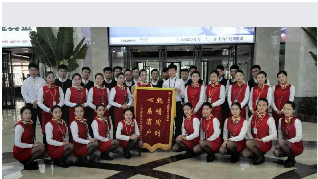
2014 级学生在三亚机场实习