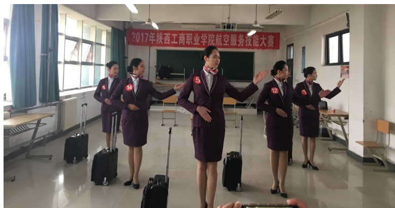
航空服务技能大赛选手风采