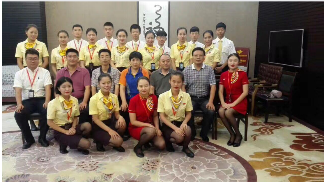
2015 级学生在三亚机场实习