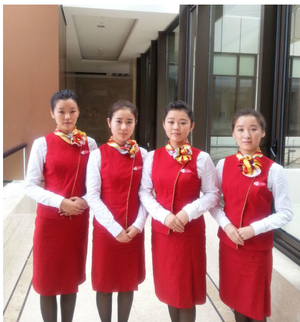
2011 级学生在三亚机场头等舱休息室实习

目前本专业已与三亚凤凰机场、海口美兰机场、西安咸阳机场、中国东方航空公司等民航企业建立合作关系。截止 2018 年 5 月，本专业共有 341 名学生分批赴海南航空集团三亚凤凰机场、海口美兰机场进行顶岗实习。实习期间表现好的学生，均可直接就业。