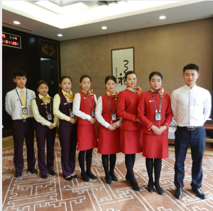
2013 级学生在三亚机场头等舱休息室实习