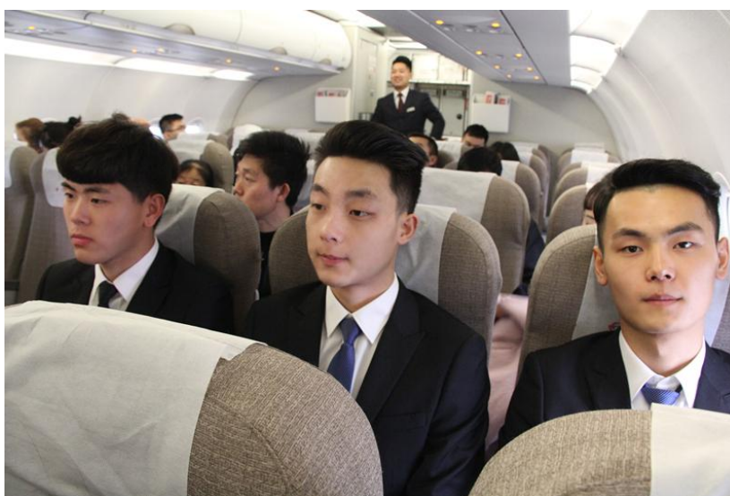
空中乘务专业学生开展专业素养体验活动 2