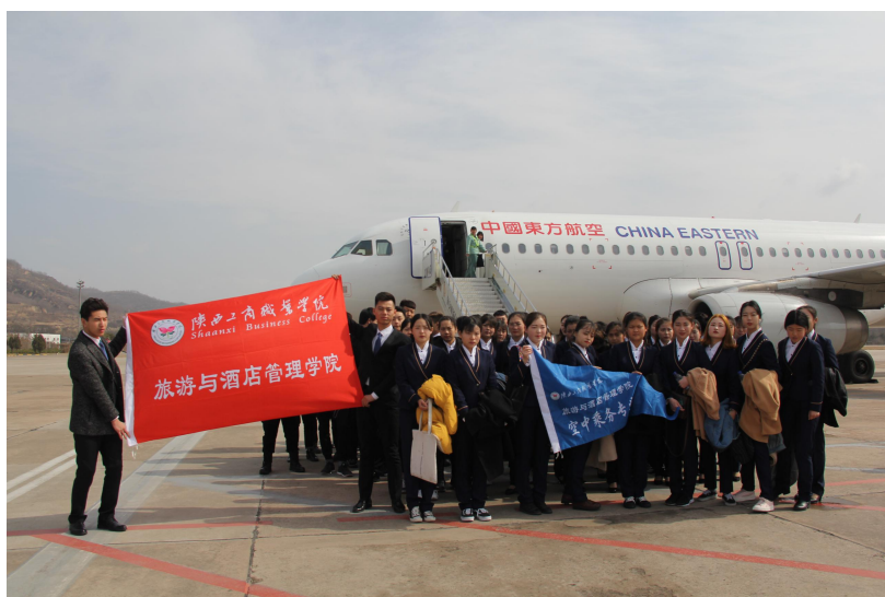
空中乘务专业学生开展专业素养体验活动 1