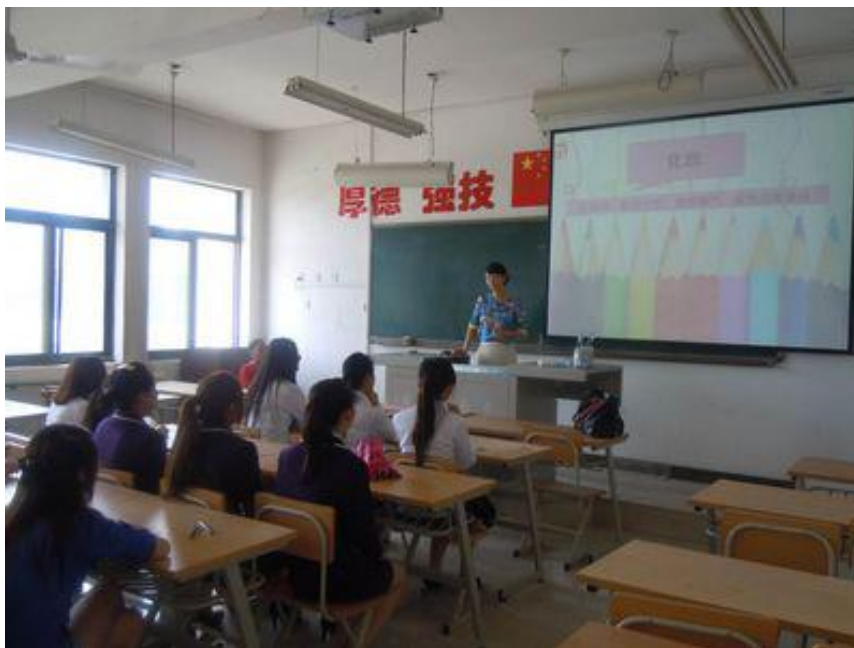
东航乘务长应邀来我系作礼仪讲座